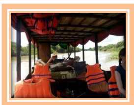
Photo bateau privé de Khuon Tour, cliquez sur l'image pour agrandir, autre photo ici

Option 1 : Transfert à Battambang en bateau privé disposant, entre autre, de hamacs pour votre confort. Vous traversez le lac Tonlé sap et continuez par la rivière Sangker en longeant Prek Toal, le sanctuaire des oiseaux , et en passant par la forêt inondée (6 à 8 heures de bateau à moteur suivant la saison).